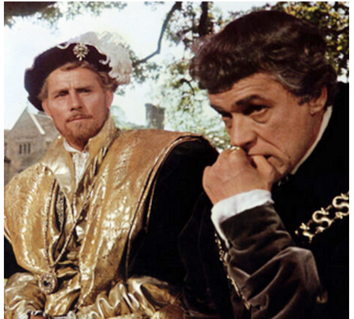
1966 UN HOMME POUR L'ÉTERNITÉ (A Man of all Seasons) de Fred Zinnemann avec Paul Scofield