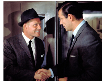
1963 BONS BAISERS DE RUSSIE (From Russia with Love) de T. Young avec Sean Connery