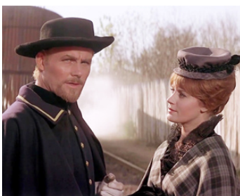
1967 CUSTER, L'HOMME DE L'OUEST (Custer of the West) de R. Siodmak avec Mary Ure