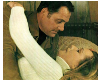
1972 LE SOUFFLE DE LA PEUR (A Reflexion of Fear) de William A. Fraker avec Sally Kellerman