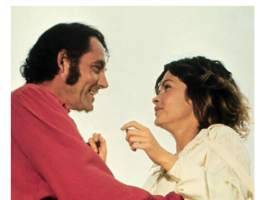
1975 LE PIRATE DES CARAÏBES (Swashbuckler) de James Goldstone avec Geneviève Bujold