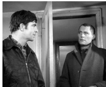
1962 LE CONCIERGE (The Caretaker) de Clive Donner avec Alan Bates