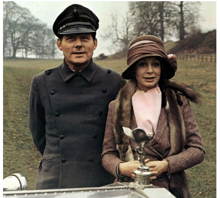
1972 LA MÉPRISE (The Hireling) d'Alan Bridges avec Sarah Miles