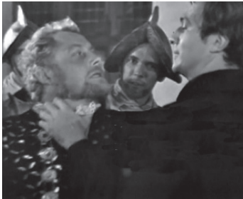
1964 HAMLET (Hamlet at Elsinore) de Philip Saville avec Christopher Plummer