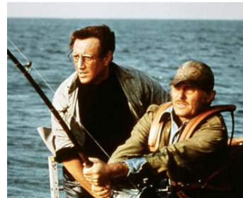
1973 LES DENTS DE LA MER (Jaws) de Steven Spielberg avec Roy Scheider