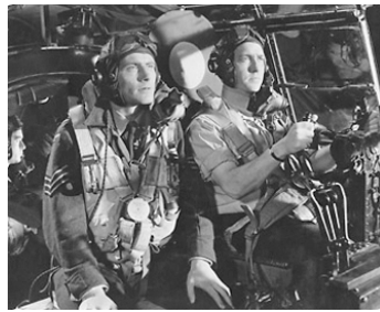
1954 LES BRISEURS DE BARRAGES (The Dam Busters) de M. Anderson avec Richard Todd