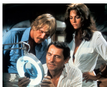
1976 LES GRANDS FONDS (The Deep) de Peter Yates avec Nick Nolte, Jacqueline Bisset