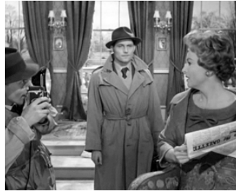
1959 LA NUIT EST MON ENNEMIE (Libel) d'Anthony Asquith avec Olivia de Havilland