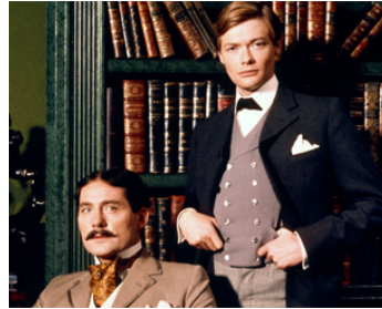
1972 LES GRIFFES DU LION (Young Winston) de Richard Attenborough avec Simon Ward