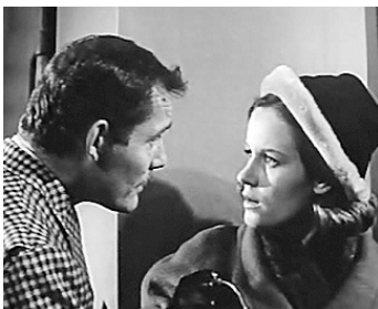
1964 THE LUCK OF GINGER COFFEY d'Irving Kershner avec Mary Ure