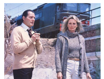
1978 AVALANCHE EXPRESS (Avalanche Express) de Mark Robson avec Linda Evans