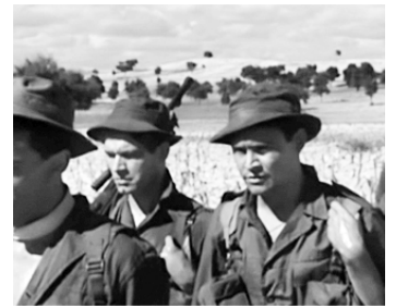
1956 LES ÉCHAPPÉS DE L'ENFER (A Hill in Korea) de Julian Aymes avec Stephen Boyd