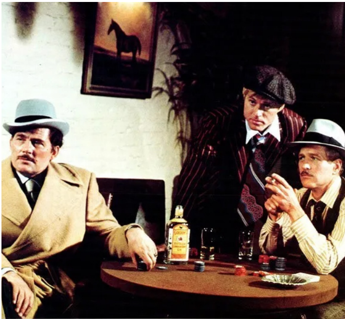
1973 L'ARNAQUE (The Sting) de George Roy Hill avec Robert Redford, Paul Newman