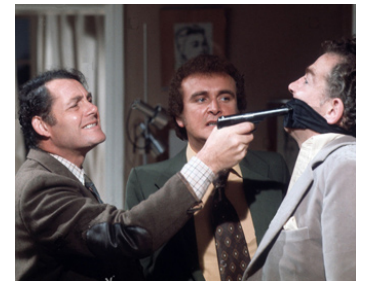
1973 THE BREAK (The Break) de William Fairchild avec Tony Shelby, Jack Crawford