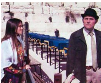
1973 UN COUP DE 2 MILLIARDS DE DOLLARS (Diamonds) de M. Golan avec Barbara Hershey