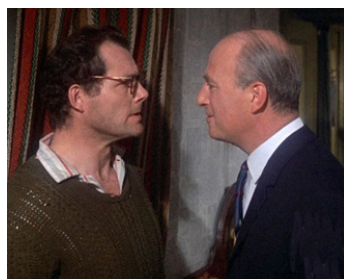
1968 L'ANNIVERSAIRE (The Birthday Party) de William Friedkin avec Patrick Magee