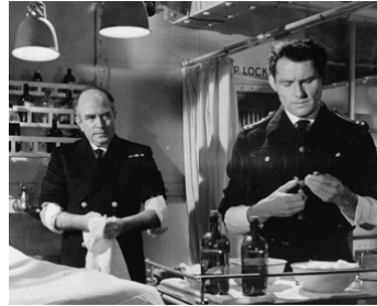
1961 ALERTE SUR LE VALIANT (The Valiant) de Roy Ward Baker avec Liam Redmont