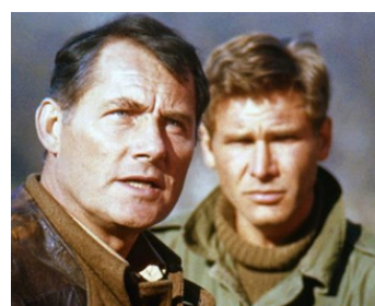
1978 L'OURAGAN VIENT DE NAVARONE (Force Ten from Navarone) de G. Hamilton avec Harrison Ford