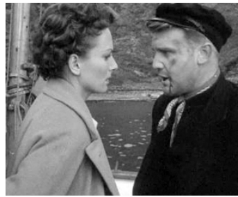
1955 DOUBLE CROSS d'Anthony Squire avec Fay Compton