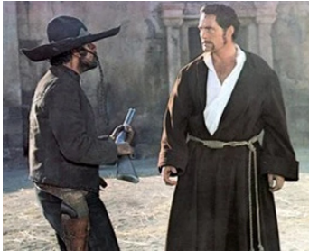
1971 LES BRUTES DANS LA VILLE (A Town called Bastard) de R. Parrish avec Al Lettieri