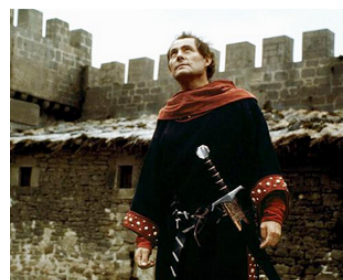
1975 LA ROSE ET LA FLÈCHE (Robin and Marian) de Richard Lester