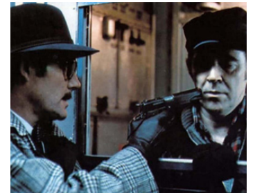
1974 LES PIRATES DU MÉTRO (Pelham 1-2-3) de Joseph Sargent avec James Broderick