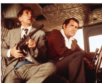
1976 DIMANCHE NOIR (Black Sunday) de John Frankenheimer avec Fritz Weaver