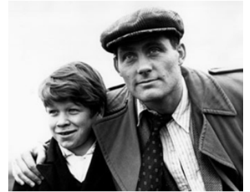
1961 LE TRAIN EN MARCHÉ (The Train Set) de Don Taylor avec Roy Holder