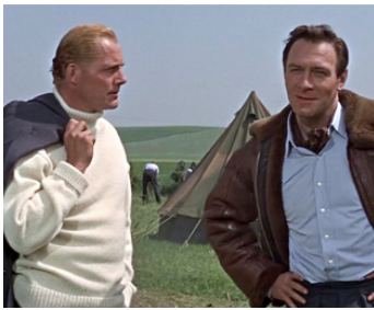
1969 LA BATAILLE D'ANGLETERRE (Battle of Britain) de Guy Hamilton avec Ch. Plummer