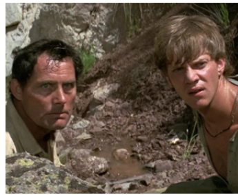
1970 DEUX HOMMES EN FUITE (Figures in a Landscape) de Joseph Losey avec M. McDowell