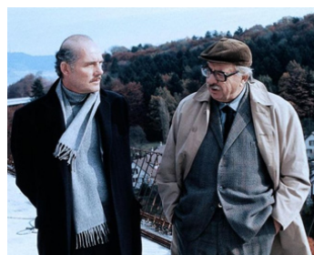
1975 DOUBLE JEU (End of the Game) de Maximilian Schell avec Martin Ritt