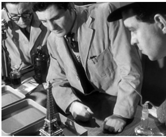
1951 DE L'OR EN BARRES (The Lavender Hill Mob) de Charles Crichton avec Arthur Mullard