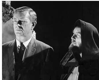
1964 A CAROL FOR ANOTHER CHRISTMAS de Joseph L. Mankiewicz avec Sterling Hayden