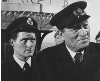
1958 REQUINS DE HAUTE MER (Sea Fury) de Cy Enfield avec Victor McLaglen